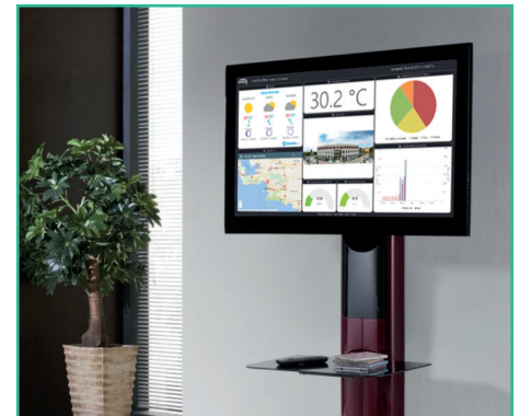
Écran de communication